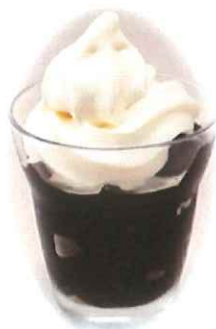
A-8. コーヒーゼリー ソフトクリームのせ 会員420円(一般450円)