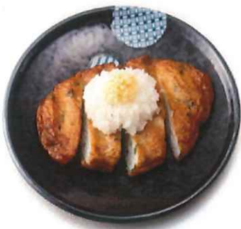
G-6. ねぎさつま揚げ 会員230円(一般260円)