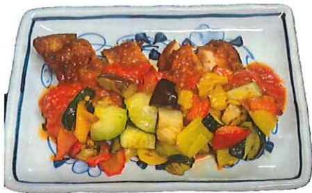
G-5.チキンの トマトソースかけ 会員980円 (一般1010円)