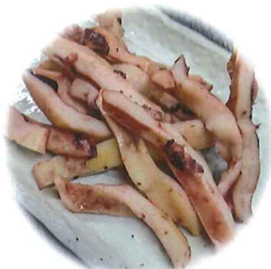
D-6. 焼きイカ 会員480円(一般510円)