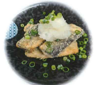
C-7. サンマ竜田 会員300円(一般330円)