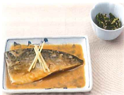
D-5.さば味噌と小鉢 ※小鉢の内容が変わる 場合がございます。 会員650円(一般680円)