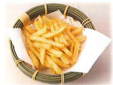
B-7. ポテトフライ 会員250円(一般280円)