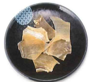
G-7. エイヒレ 会員310円(一般340円)