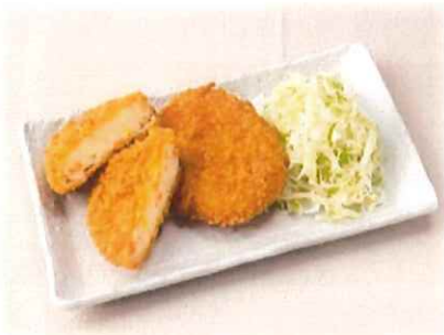
E-5.野菜コロッケ(2個) 会員300円(一般330円)