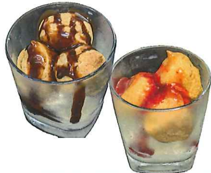
A-8. プチシュークリームソフト (チョコまたはイチゴ) 会員420円(一般450円)