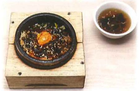
H-4.石焼きビビンバ (スープ付) 会員980円 (一般1010円)