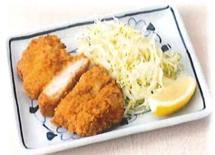
C-5.とんかつ ロースカツまたはヒレカツ 会員520円(一般550円)