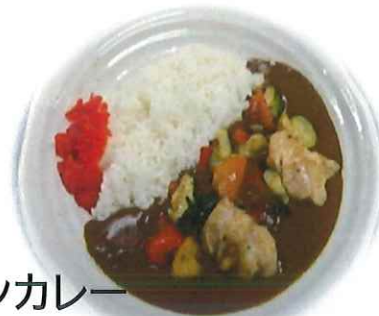
野菜チキンカレー