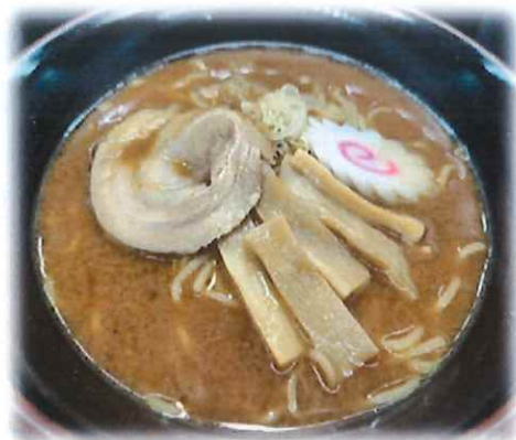
B-4.味噌ラーメン 会員630円(一般660円)