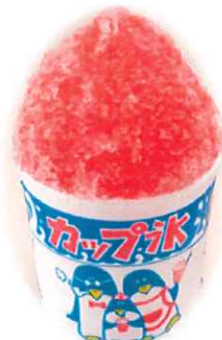
C-9. かき氷 イチゴ/メロン/レモン/ ブルーハワイ 会員220円(一般250円)