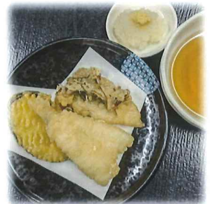
B-5.ミニ天ぷら (きす天・舞茸天・さつまいも天) 会員450円(一般480円)