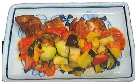
G-5.チキンのトマトソースかけ 会員980円(一般1010円)