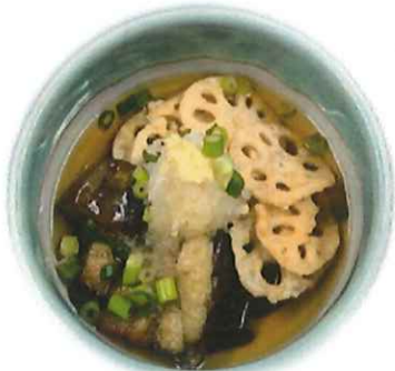
H-7. なすと蓮根の揚げ浸し 会員350円(一般380円)