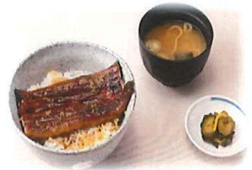
H-6.うな丼 (漬物・味噌汁付) 会員1450円 (一般1480円)