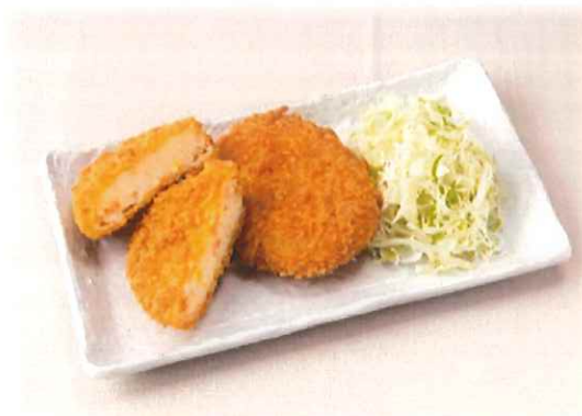
E-5.野菜コロッケ(2個) 会員300円(一般330円)