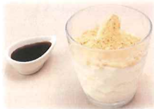
B-8. 黒蜜きな粉ソフト 会員520円(一般550円)