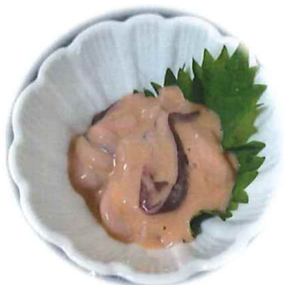
G-6. イカの塩辛 会員230円(一般260円)