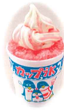
D-9. フラッパ各種 イチゴ/メロン/レモン/ ブルーハワイ 会員390円(一般420円)