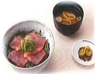
H-3.美味まぐろ丼 (漬物・味噌汁付) 会員910円 (一般940円)