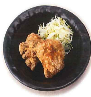
G-7. とりから揚げ (2個) 会員310円(一般340円)