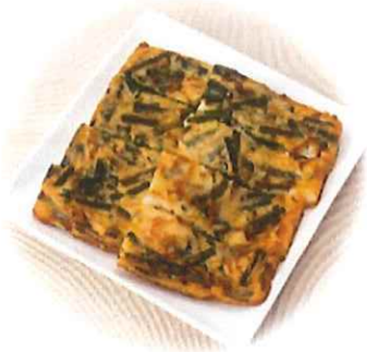
E-6. 韓国チヂミ風海鮮焼き 会員550円(一般580円)