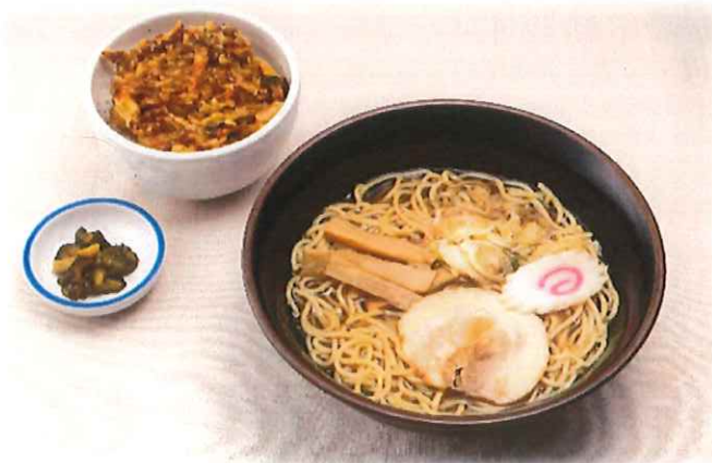
C-4.醤油ラーメン または 味噌ラーメン 選べるミニ丼セット ※ミニ丼ぶりが選べます。 会員960円(一般990円)