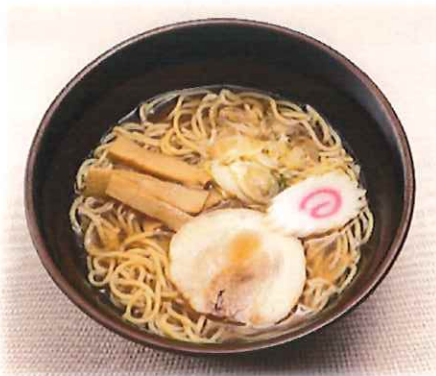
B-4.醤油ラーメン 会員630円(一般660円)