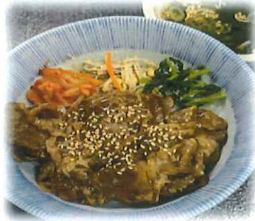
G-3.焼肉丼 (スープ付) 会員1250円 (一般1280円)