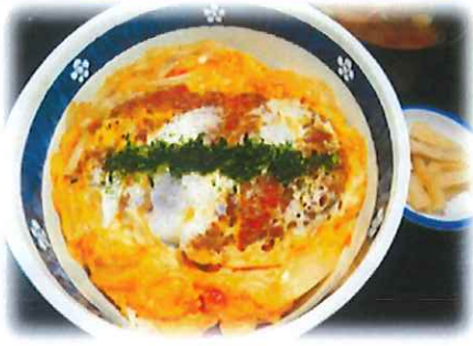
G-4.カツ丼 (漬物・味噌汁付) 会員870円 (一般900円)