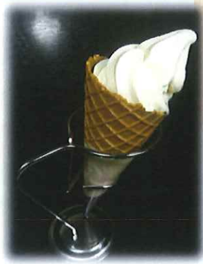
C-8. 小岩井農場の ソフトクリーム 会員520円(一般550円) ※普通サイズ