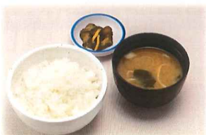
A-5. ご飯セット (漬物・味噌汁) 会員300円 (一般300円)