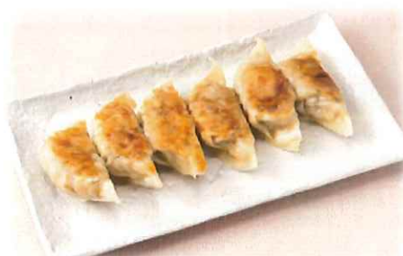
E-7. 薄皮焼き餃子 会員450円(一般480円)