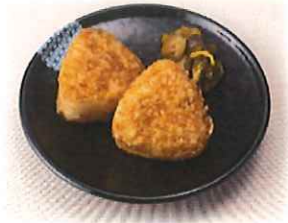
D-4.焼きおにぎり (2個) 会員320円 (一般350円)