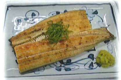
H-5. うなぎの白焼き 会員1500円 (一般1530円)