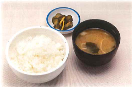
A-5. ご飯セット (漬物・味噌汁) 会員300円(一般300円)