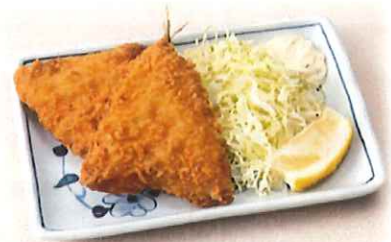
B-5.アジフライ 会員450円 (一般480円)