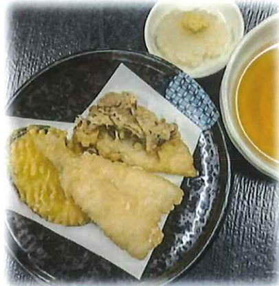
B-5.ミニ天ぷら (きす天・舞茸天・さつまいも天) 会員450円(一般480円)