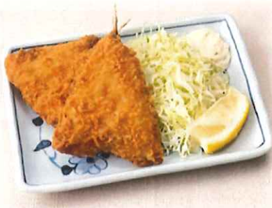
B-5.アジフライ 会員450円(一般480円)