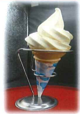
D-8. 小岩井農場の ソフトクリーム 会員280円(一般310円) ※小さいサイズ