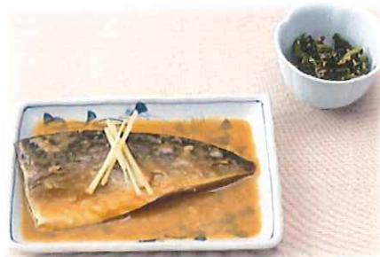
D-5.さば味噌と小鉢 ※小鉢の内容が変わる 場合がございます。 会員650円(一般680円)