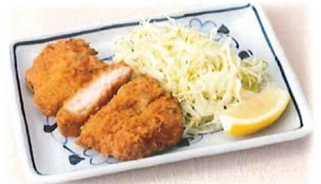
C-5.とんかつ ロースカツまたはヒレカツ 会員520円(一般550円)