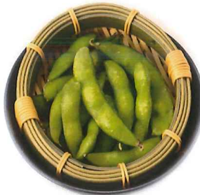
F-6. えだ豆 会員200円(一般230円)