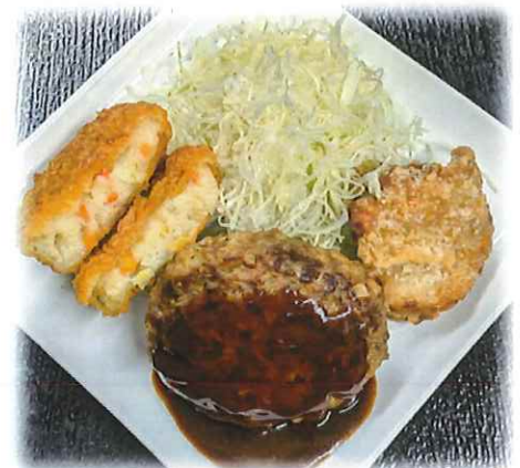
F-5.ミックス (ハンバーグ・とりから揚げ・コロッケ) 会員700円(一般730円)