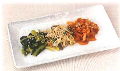
F-7. ナムル3種盛り 会員300円(一般330円)