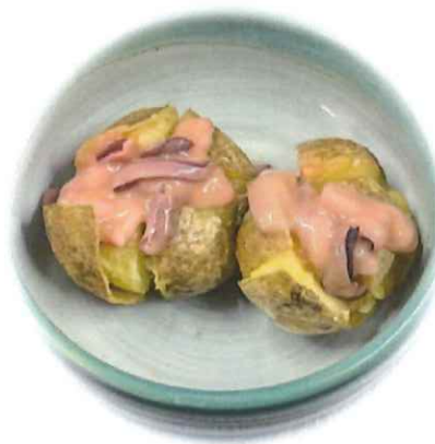
F-7. 皮つきじゃがいも (塩辛のせ) 会員300円(一般330円)