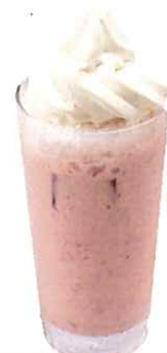
A-9. 豆乳苺ソフトシェイク 会員500円(一般530円)