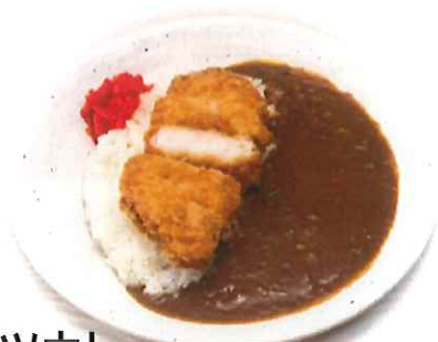
ロースカツカレー