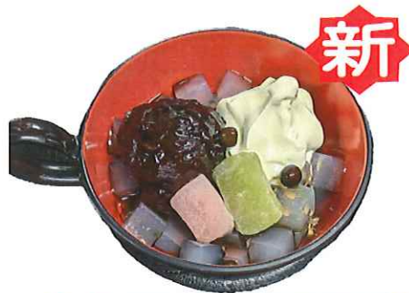
B-9. クリームあんみつ 会員600円(一般630円)