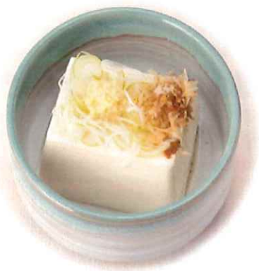
F-6. 冷奴 会員200円(一般230円)