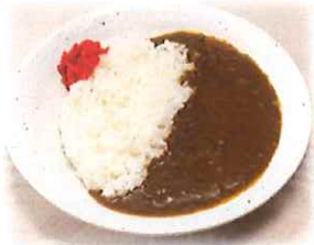
F-4.カレーライス 会員620円 (一般650円)