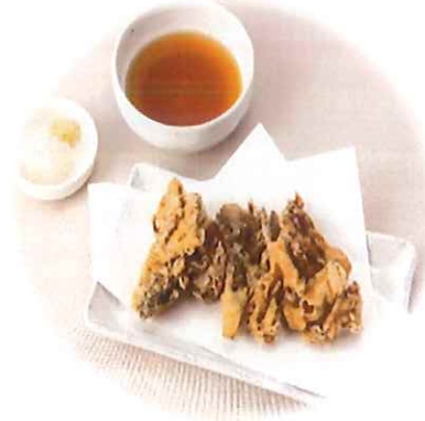
E-7. 舞茸天ぷら (天つゆ付) 会員450円(一般480円)