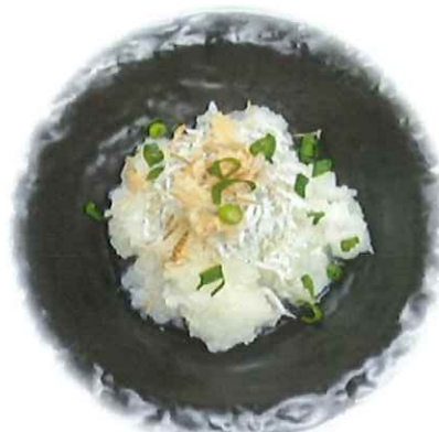
B-7. しらすおろし 会員250円(一般280円)