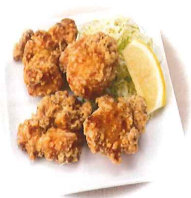
D-7. とりから揚げ 会員600円(一般630円)