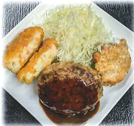
F-5.ミックス (ハンバーグ・とりから揚げ・コロッケ) 会員700円(一般730円)