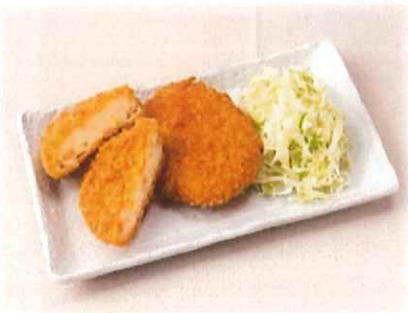
E-5.野菜コロッケ(2個) 会員300円(一般330円)