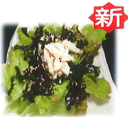
B-7. チョレギサラダ 会員380円(一般410円)