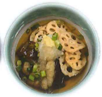
H-7. なすと蓮根の揚げ浸し 会員350円 (一般380円)