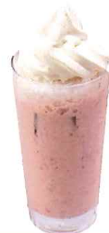
A-9.豆乳苺ソフトシェイク 会員500円(一般530円)