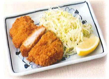
C-5.とんかつ ロースカツまたはヒレカツ 会員520円(一般550円)