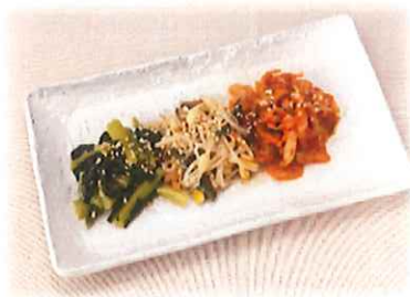
C-7. ナムル3種盛り 会員300円(一般330円)