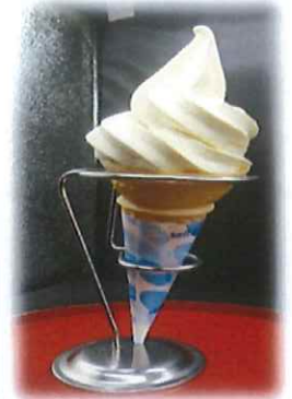
D-8.小岩井農場の ソフトクリーム 会員280円(一般310円) ※小さいサイズ