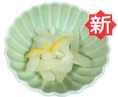
A-8. ゆず大根 ※120円券※ 会員120円(一般120円)