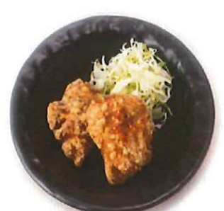
G-7. とりから揚げ (2個) 会員310円 (一般340円)