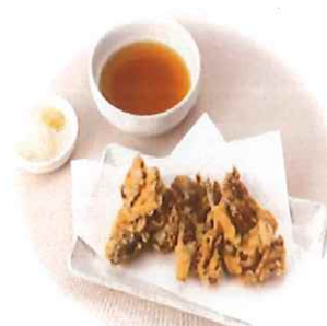
E-7. 舞茸天ぷら (天つゆ付) 会員450円 (一般480円)