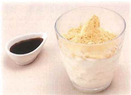
C-8.黒蜜きな粉ソフト 会員520円(一般550円)