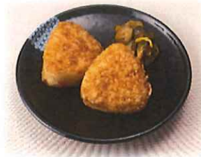
D-4.焼きおにぎり (2個) 会員320円 (一般350円)