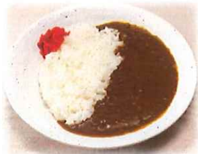
F-4.カレーライス 会員620円 (一般650円)