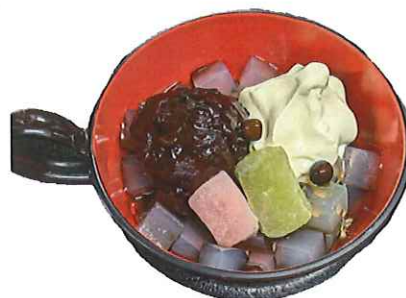
B-9.クリームあんみつ 会員600円(一般630円)