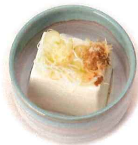
F-6. 冷奴 会員200円 (一般230円)