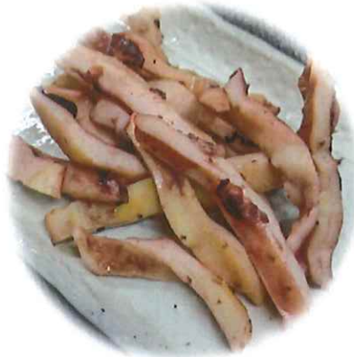
D-6. 焼きイカ 会員480円(一般510円)