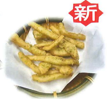
C-6. さきイカ風磯辺天ぷら 会員330円(一般360円)