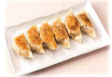
E-7. 薄皮焼き餃子 会員450円(一般480円)