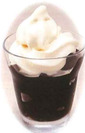
B-8.コーヒーゼリー ソフトクリームのせ 会員420円(一般450円)