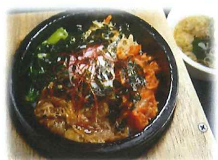
H-4.石焼きビビンバ (スープ付) 会員980円 (一般1010円)