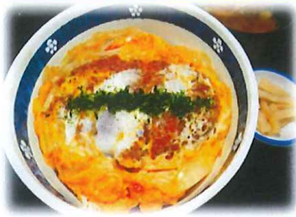
G-4.カツ丼 (漬物・味噌汁付) 会員870円 (一般900円)