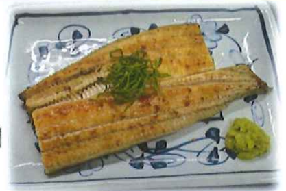
G-5. うなぎの白焼き 会員1500円 (一般1530円)