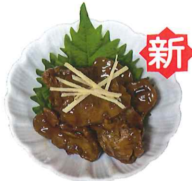
C-7. 鶏肝しぐれ煮 会員300円(一般330円)