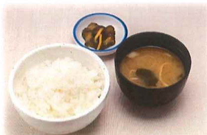
A-5. ご飯セット (漬物・味噌汁) 会員300円 (一般300円)