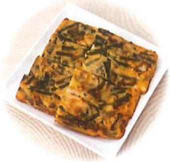
E-6. 韓国チヂミ風海鮮焼き 会員550円(一般580円)