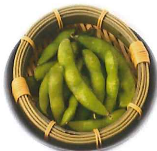
F-6. えだ豆 会員200円 (一般230円)