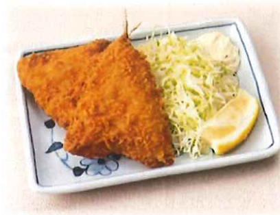
B-5.アジフライ 会員450円(一般480円)