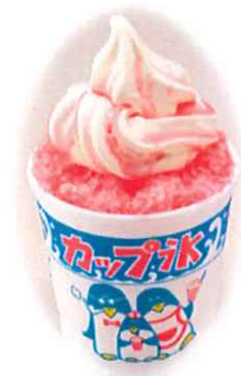
D-9.フラッパ各種 イチゴ/メロン/レモン/ ブルーハワイ 会員390円(一般420円)