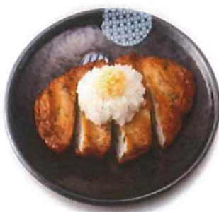
G-6. ねぎさつま揚げ 会員230円 (一般260円)