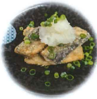
E-5. サンマ竜田 会員300円 (一般330円)