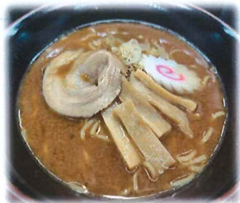
B-4.味噌ラーメン 会員630円(一般660円)