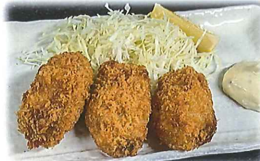
D-5.カキフライ 会員650円(680円)