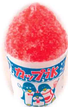
C-9.かき氷 イチゴ/メロン/レモン/ ブルーハワイ 会員220円(一般250円)