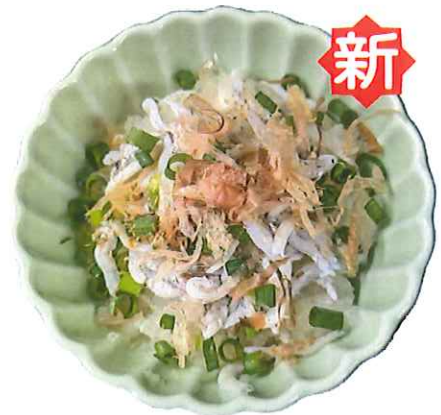
H-6. しらすおろし 会員200円(一般230円)