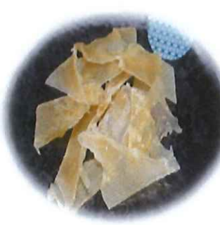
G-7. エイヒレ 会員310円 (一般340円)