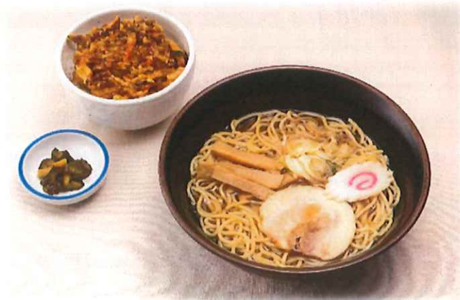
C-4.醤油ラーメン または 味噌ラーメン 選べるミニ丼セット ※ミニ丼ぶりが選べます。 会員960円(一般990円)