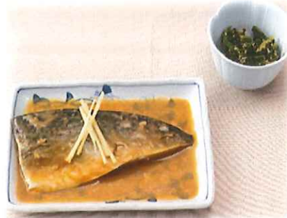
D-5.さば味噌と小鉢 ※小鉢の内容が変わる 場合がございます。 会員650円(一般680円)