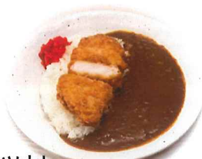
ロースカツカレー