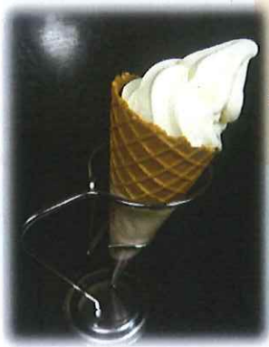
C-8.小岩井農場の ソフトクリーム 会員520円(一般550円) ※普通サイズ