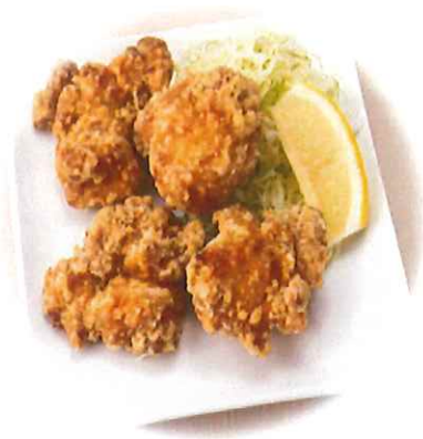
D-7. とりから揚げ 会員600円(一般630円)