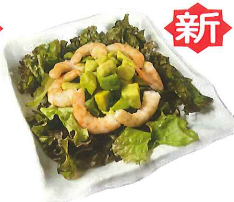
A-7. 海老とアボカドサラダ 会員600円(一般630円)