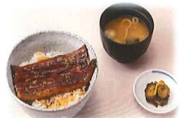
H-5.うな丼 (漬物・味噌汁付) 会員1450円 (一般1480円)