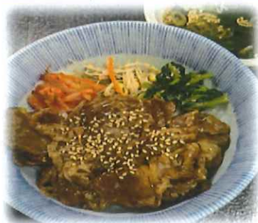
G-3.焼肉丼 (スープ付) 会員1250円 (一般1280円)