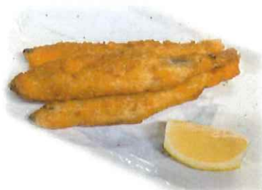
C-6. ししゃもフライ 会員330円(一般360円)