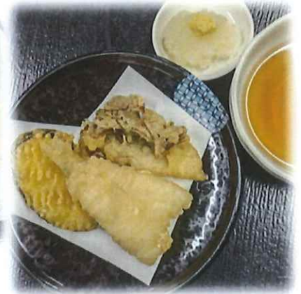
B-5.ミニ天ぷら (きす天・舞茸天・さつまいも天) 会員450円(一般480円)