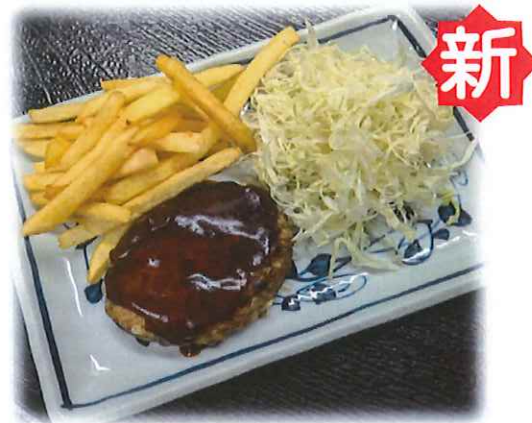
F-5.ハンバーグ 会員450円 (一般480円)