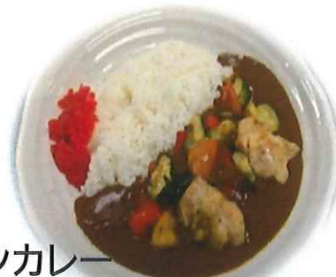
野菜チキンカレー