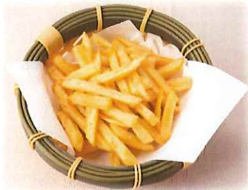
F-7. ポテトフライ 会員250円(一般280円)