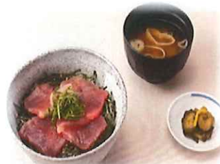
H-3.美味まぐろ丼 (漬物・味噌汁付) 会員910円 (一般940円)